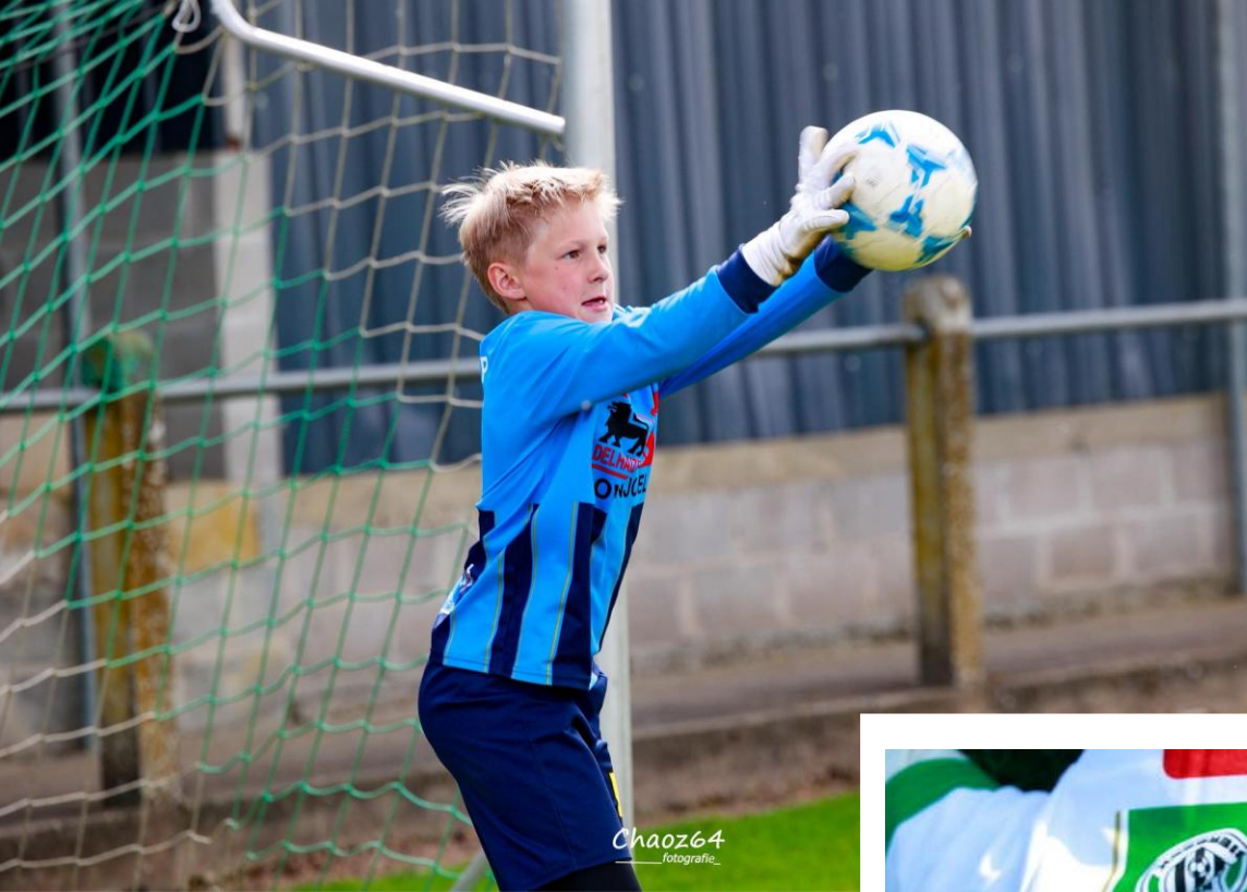
Chaoz64 — fotografie