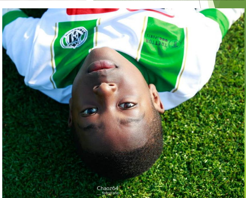
Chaoz64 — fotografie