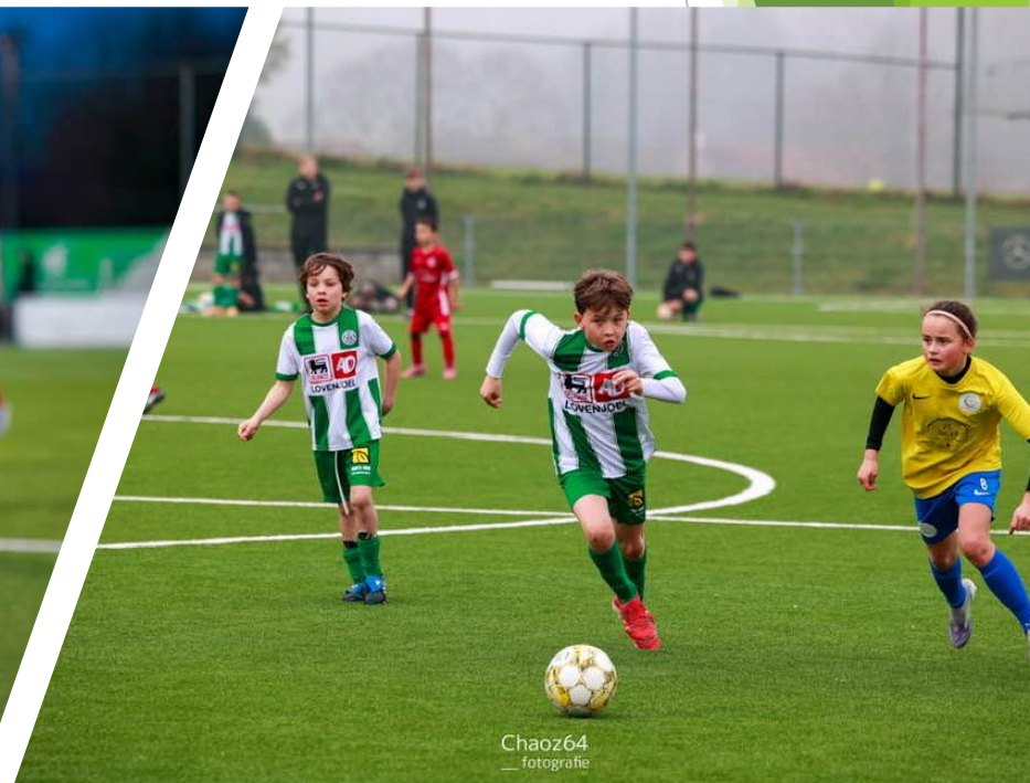
Chaoz64 _ fotografie