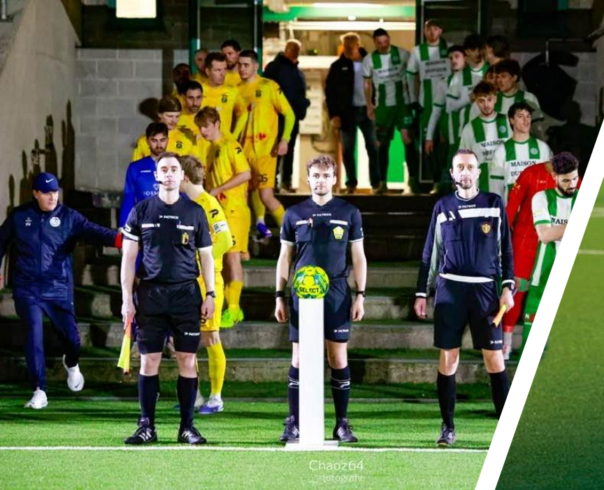
Chaoz64 _ fotografie