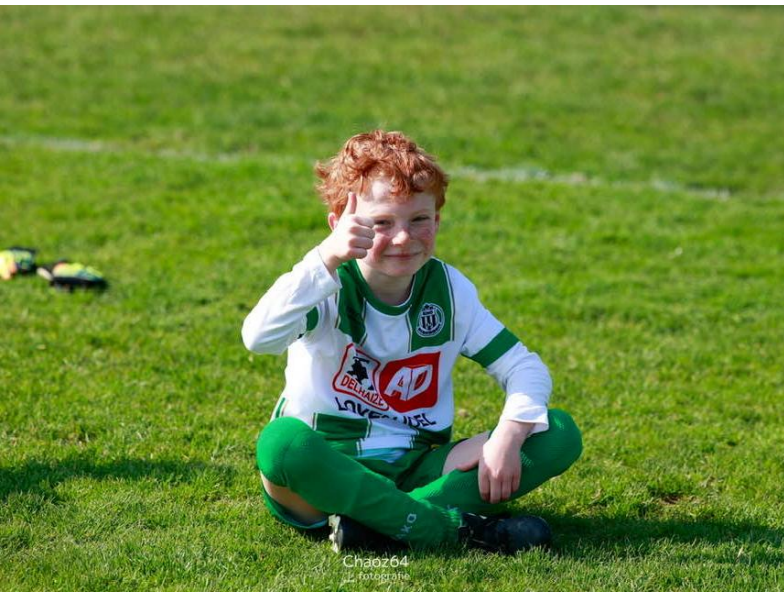
Chaoz64 — fotografie