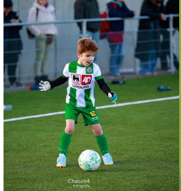
Chaoz64 — fotografie